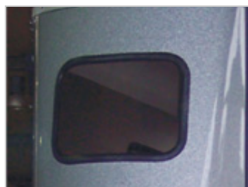
Fenêtre panoramique En serie: Fenêtre panoramique