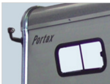
Fenêtre coulissante 2 fenêtres coulissante en serie.